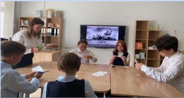
В ЦДИ прошла акция «Голубь мира»

Центр детских инициатив – это центральное место встреч и сборов детских общественных объединений штаб ребят, место, где обучающиеся смогут создавать и реализовывать собственные внеклассные проекты, рабочее место советника директора по воспитанию и взаимодействию с детскими общественными объединениями.