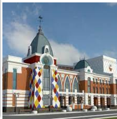
Алтайский Государственный Театр Кукол "Сказка"

В выпуске приняли участие: участники ЦДИ