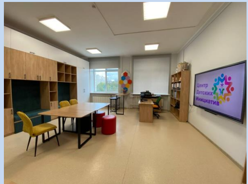
Так выглядит кабинет, в котором организован ЦДИ

Сегодня мы ответим на этот вопрос. ЦЕНТР ДЕТСКИХ ИНИЦИАТИВ является добровольным, самоуправляемым общественным объединением, осуществляющим свою деятельность в соответствии с законодательством Российской Федерации, созданным на основе совместной деятельности педагогов и учащихся для защиты общих интересов, удовлетворяющих социальные потребности объединившихся.