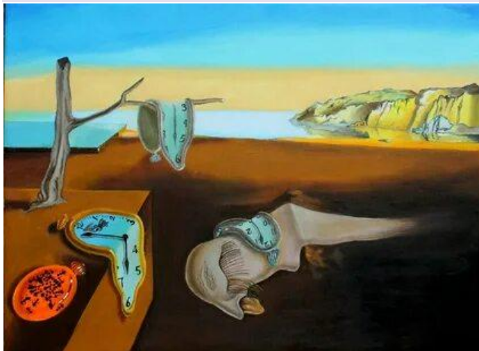
«Утекающее время», 1931 г., холст, масло, Сальвадор Дали.