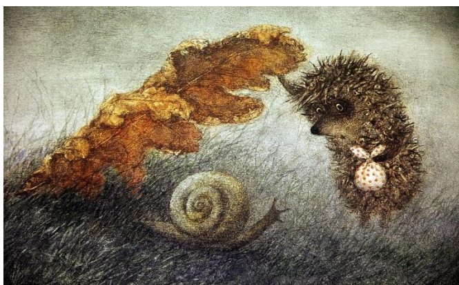
Иллюстрации: «Ёжик в тумане», мультфильм, 1975 г., СССР, реж. Ю. Норштейн.

«Я очень люблю все, что связано с музыкой (танцы, пение, игру на музыкальных инструментах). Я часто пою у себя в голове, а танцы – мое второе «я». Просто это никому не заметно. Но так и должно быть – это же время свободы и мечты».