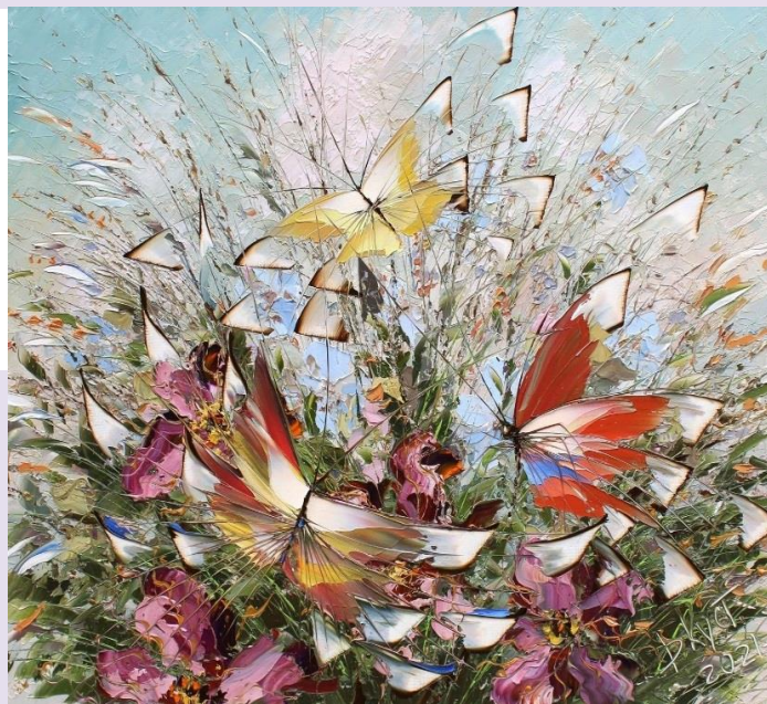
«Бабочки», 2021 г., холст, масло, Дмитрий Кустанович

Вот я о чем мечтаю этим унылым днем И зябкая дрожь пробегает в усталом мозгу моем. Поль Элюар (1895-1952).