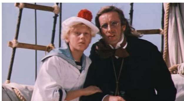
Кадр из фильма «В поисках капитана Гранта», 1985 г., СССР.

3) Книга английской писательницы Джейн Остин «Гордость и предубеждение». Наверное, покажется странным, что я включила её в список. В семействе Беннет четыре дочери, и у них практически нет шансов выйти замуж, потому что семья не богата. Но в результате интересных событий практически все дочери оказываются замужем, и замуж все они выходят по любви, что редкость для того времени.