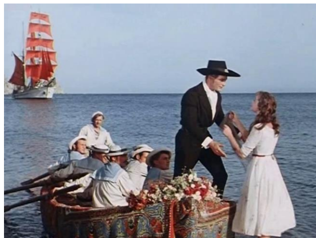
Кадр из фильма «Алые паруса», 1961 г., СССР.

4) Также я посоветовала бы обратить внимание на роман Жюль Верна «Дети капитана Гранта». Это увлекательная история о том, как двое детей отправляются на поиски своего отца – капитана Гранта. Их ждет череда необыкновенных приключений. Читатель до самой последней страницы думает о том, удастся ли этим детям исполнить свою мечту - найти своего отца. Конечно, их мечты сбываются.