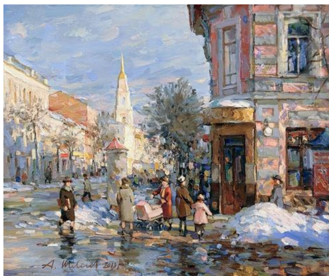
«Весна на Крестовой улице», 2013 г., холст, масло. Александр Шевелёв. Россия.

«В этом году весна наступила поздно, но несмотря на это мы все её ждали с нетерпением. У меня настроение с каждым днем становится лучше. Я говорю весне спасибо просто за то, что она есть, а значит за ней придет и лето».