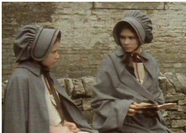
Кадр из фильма «Джен Эйр», 1983 г., Великобритания.

Книга рассказывает о бедной сироте, страдающей от притеснений родственников, затем от школьных наставников. Джейн мечтает получить возможность жить независимой жизнью, самостоятельно, и когда-нибудь выбраться из нищеты, может, встретить свою любовь. Героиня становится гувернанткой у мистера Рочестера и встречает свою любовь. Правда, на пути к счастью её ждет много испытаний. Я не буду рассказывать каких, но, как вы можете догадаться по тому, что книга включена в этот список, мечты этой героини сбываются.