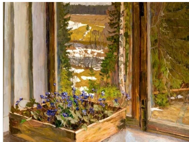
«Подснежники», 1911 г., холст, масло. Станислав Жуковский. Россия.

«Весной все вокруг как будто добреют, ведь скоро лето и они смогу куда-то уехать на отдых. После долгой и холодной зимы люди радуются даже небольшому теплу. Очень интересно следить за природой и тем, как она развивается. Но у весны есть и минусы: например, когда растает снег, на улице очень много слякоти и грязи, глубоких луж. Несмотря на эти незначительные минусы я очень люблю весну!»