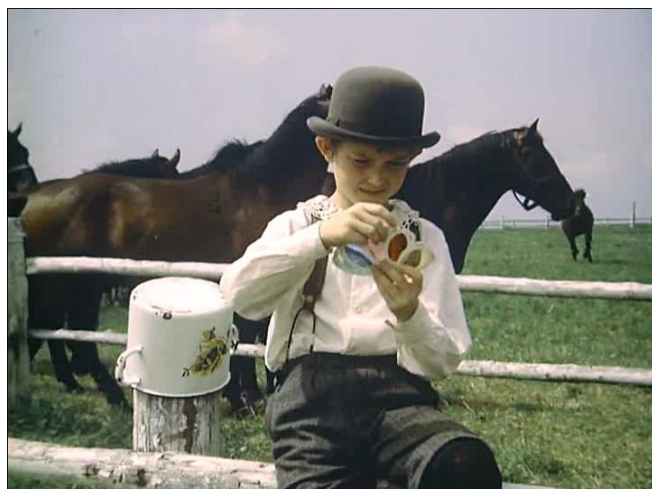
Кадр из фильма «Я умею прыгать через лужи», 1970 г., Чехословакия.

9) Хотелось бы посоветовать также книгу австралийского писателя Алана Маршалла «Я умею прыгать через лужи». Главный герой этого произведения всегда хотел пойти по стопам своего отца - стать объездчиком диких лошадей. Но случилось так, что в шесть лет коварная болезнь полиомиелит поставила крест на его мечте. Теперь герою надо ещё научиться ходить. Это автобиографическая книга о мужественном преодолении трудных жизненных обстоятельств. Обращает на себя внимание то, как автор с юмором умеет рассказать о самых сложных проблемах. Книга возрождает в душе читателя надежду на то, что всё в нашей жизни будет хорошо, всё мы можем преодолеть и свои мечты сумеем реализовать.