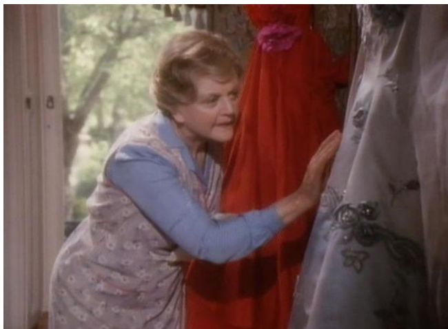
Кадр из фильма «Миссис Харрис едет в Париж», 1992 г., США.

Однажды она увидела такое платье у одной из своих клиенток, и с тех пор у нее появилась такая мечта. Накопив, как она считает, много денег, миссис Харрис отправляется в модный дом Диора. Дальше начинаются ее забавные приключения. Это книга о доброте, взаимопомощи, очень теплая история, и, наверное, ее стоит читать, чтобы поднять себе настроение в трудные времена.