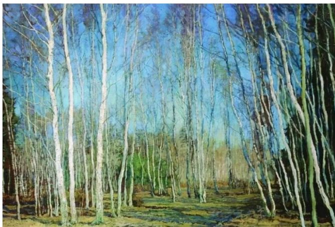
«Голубая весна», 1930 г., холст, масло. Василий Бакшеев. Россия.

«Весна – это второе по счёту время года. Она длится 92 дня. В это время года дети растут быстрее. 20 марта – день весеннего равноденствия. Весной все деревья пробуждаются, а первое из них – сакура. В некоторых странах весна наступает в сентябре. Известный композитор Антонио Вивальди написал концерт про это время года, Чайковский создал фортепианный цикл, а Григ – пьесу «Весной». «Весна» – советская комедия 1947 года».