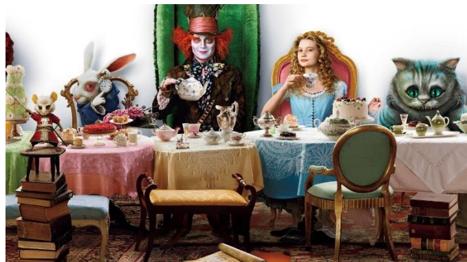
Кадр из фильма «Алиса в стране чудес», 2010 г., США.