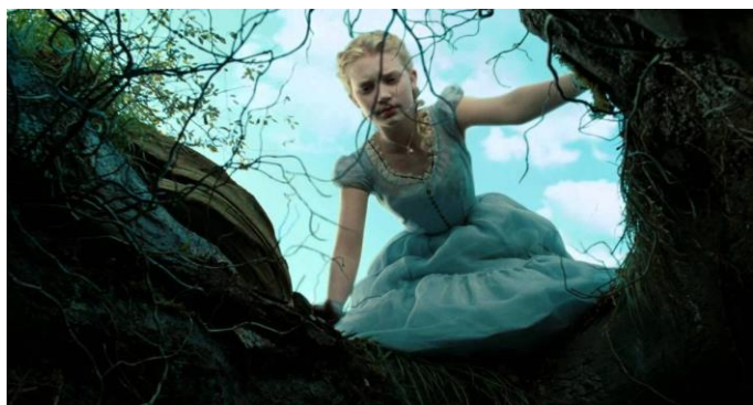
Кадр из фильма «Алиса в стране чудес», 2010 г., США.