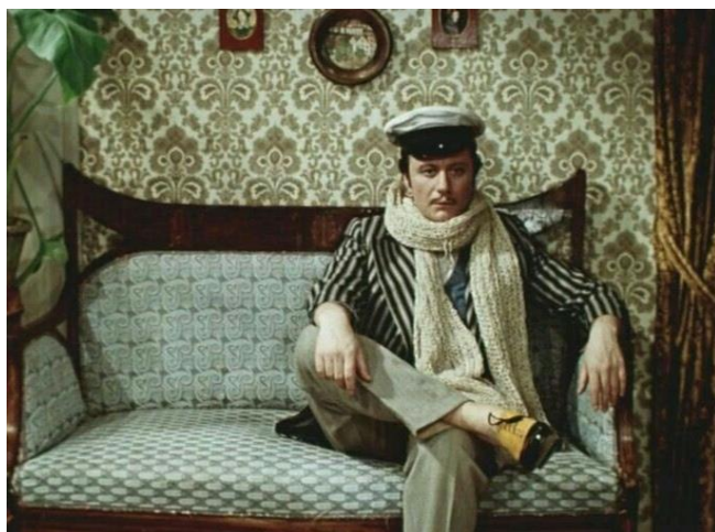
Кадр из фильма «Двенадцать стульев», 1976 г., СССР.

12) Кстати, вспомнила еще одну книгу в связи с «Портретом Дориана Грея». У Бальзака есть замечательный роман под названием «Шагреновая кожа». Там тоже есть мечта. Герой, благородный и бедный молодой учёный, мечтает о том, чтобы все его желания сбывались, и некий таинственный антиквар (фантастический персонаж) вручает ему всемогущий талисман - кусок шагреновой кожи, который способен мгновенно исполнять любые желания. Однако расплата за такое волшебство не заставит себя долго ждать. Всякий раз, когда исполняется его желание, кусок этой кожи уменьшается, а вместе с ней сокращается жизнь самого героя. Поэтому, прежде чем загадать желание, надо подумать, важно ли для тебя это желание, или нет. На куске кожи написано «Бойся своих желаний, ибо они исполняются». Герой сначала не понимает, в чем смысл, и загадывает множество самых разнообразных желаний, но кожа-то уменьшается, и когда он осознает, что за свои желания он платит собственной жизнью, то становится невообразимым скрягой. Эта поучительная история тоже в определенном смысле о мечте. Я предпочитаю книги добрые и поучительные, с большой симпатией отношусь к советской литературе. Здесь не все книги такие, однако я, бесспорно, выбирала классическую литературу».