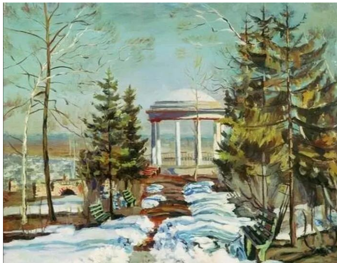
«Ранняя весна (беседка в парке)», 1910 г., холст, масло. Станислав Жуковский. Россия.

«Весна – это не просто одно из времен года, это – новая жизнь. Это время прекрасного настроения, улыбок, счастья и любви. Каждому хочется поделиться своими положительными эмоциями с близкими. Весной я очень люблю гулять, встречаться с друзьями, и с уроками тоже всё хорошо, потому что чувствуется прилив сил. В это время года я понимаю, что все возможно, просто нужно стремиться достигнуть своих целей».